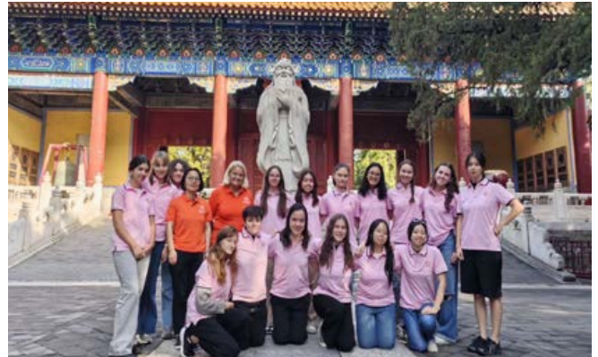
Temple de Confucius (551-479 avant J.-C.)

Lors des visites culturelles, des exposés sur chaque site sont prévus : Place Tian an men et Cité Interdite,