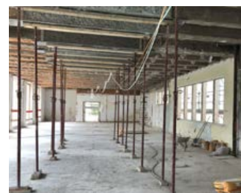
Futur magasin des archives

À l'issue de cette visite très intéressante, nous avons été conviés à un émouvant moment musical dans la grande bibliothèque, suivi d'une collation et de la visite de notre chère Maison.